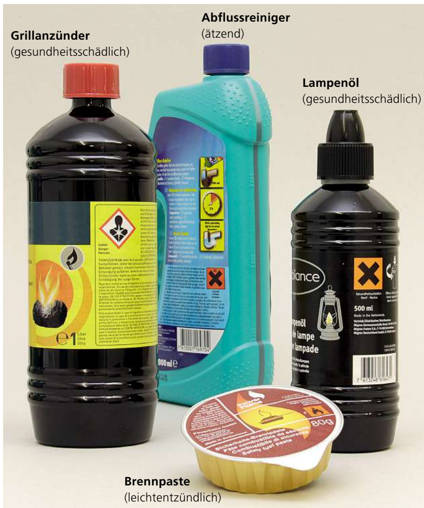
Abbildung 1: Chemikalien sind aus unserem Alltag nicht mehr wegzudenken. Doch deren Verwendung birgt auch Risiken.

Seit Ende 2010 sind auch die Schweizer Hersteller von Chemikalien dazu verpflichtet, ein erweitertes Sicherheitsdatenblatt zu erstellen und den Abnehmern zur Verfügung zu stellen. Dieses enthält im Anhang die viel diskutierten Expositionsszenarien, welche die Verwendungsbedingungen und die Massnahmen für das Risikomanagement definieren. Zusätzlich wird die Risikoanalyse auch für den Konsumenten und für die Umwelt durchgeführt. Den Betrieben wird damit ermöglicht, für diese Stoffe umfassendere Informationen für den Schutz des Menschen und der Umwelt abzuleiten als bisher.