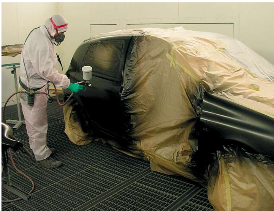
Abbildung 2: Das Sicherheitsdatenblatt richtet sich an professionelle Anwender, beispielweise einen Autolackierer.