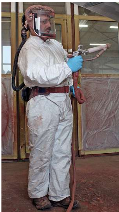
Abbildung 3: Schutz-ausrüstung für die Sprühanwendung von gefährlichen Produkten.

Das erweiterte Sicherheitsdatenblatt (eSDB) erweitert, wie der Begriff andeutet, die Information zum Schutz der Mitarbeitenden und der Umwelt. Im eSDB wird detailliert auf alle relevanten Verwendungen des Produktes eingegangen und quantitativ gezeigt, unter welchen Arbeitsbedingungen die Anwender und Anwenderinnen für die jeweilige Verwendung der Chemikalie geschützt sind. Idealerweise wird das erweiterte Sicherheitsdatenblatt durch Arbeitsplatz-Messungen ergänzt und die Plausibilität der Angaben im eSDB damit erhöht.